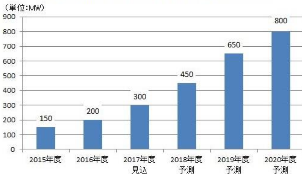
太陽光発電所セカンダリー市場推移と予測 (2018年5月公表)

昨今、新たな取引市場として、既に稼働している太陽光発電所の売買「太陽光発電所セカンダリー市場」が形成されております。市場調査会社の株式会社矢野経済研究所によると、太陽光発電所セカンダリー市場の市場規模(当該年度に取引されたあるいは取引される予定の稼働済み太陽光発電所の発電出力ベース)は、将来の展望として2018年度の市場規模は450MW、2019年度は650MW、2020年度は800MWまで拡大すると予測しております。